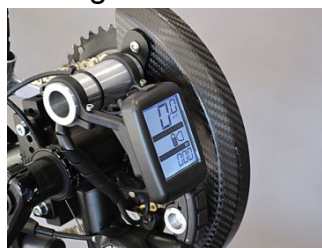
KIT PEDALATA ANSMANN

La larghezza della seduta è disponibile nelle misure: 38,5 40,5 42,5cm.