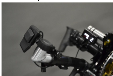
CAMBIO INTERNO "ALFINE Di2"