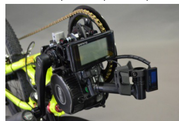
KIT BAFANG+Di2 SHIMANO